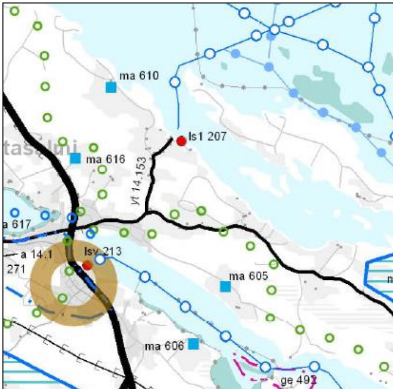
Kuva: Ote Etelä-Savon maakuntakaavasta