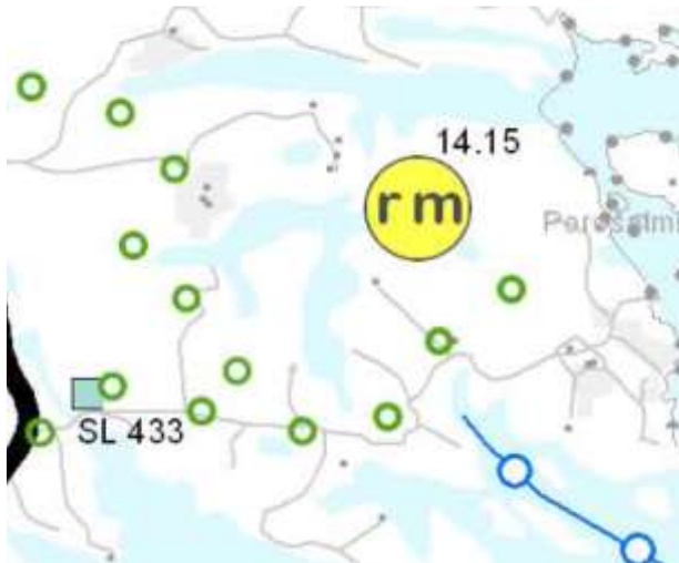
Kuva 2. Ote Etelä-Savon maakuntakaavasta

Etelä-Savon maakuntakaava on hyväksytty 29.5.2009. Kaavassa on esitetty alueen maakunnallisesti tai valtakunnallisesti merkittävät kohteet ja verkostot. Maakuntakaava ohjaa yleiskaavaa ja sen merkinnät tulee huomioida yleiskaavaa laadittaessa. Maakuntakaavassa alueen vieritse on osoitettu retkeilyreitti. Viereiselle (Poronsalmen) suunnittelualueelle on osoitettu matkailupalveluiden alue, ja sille tuleva laivaväylä.