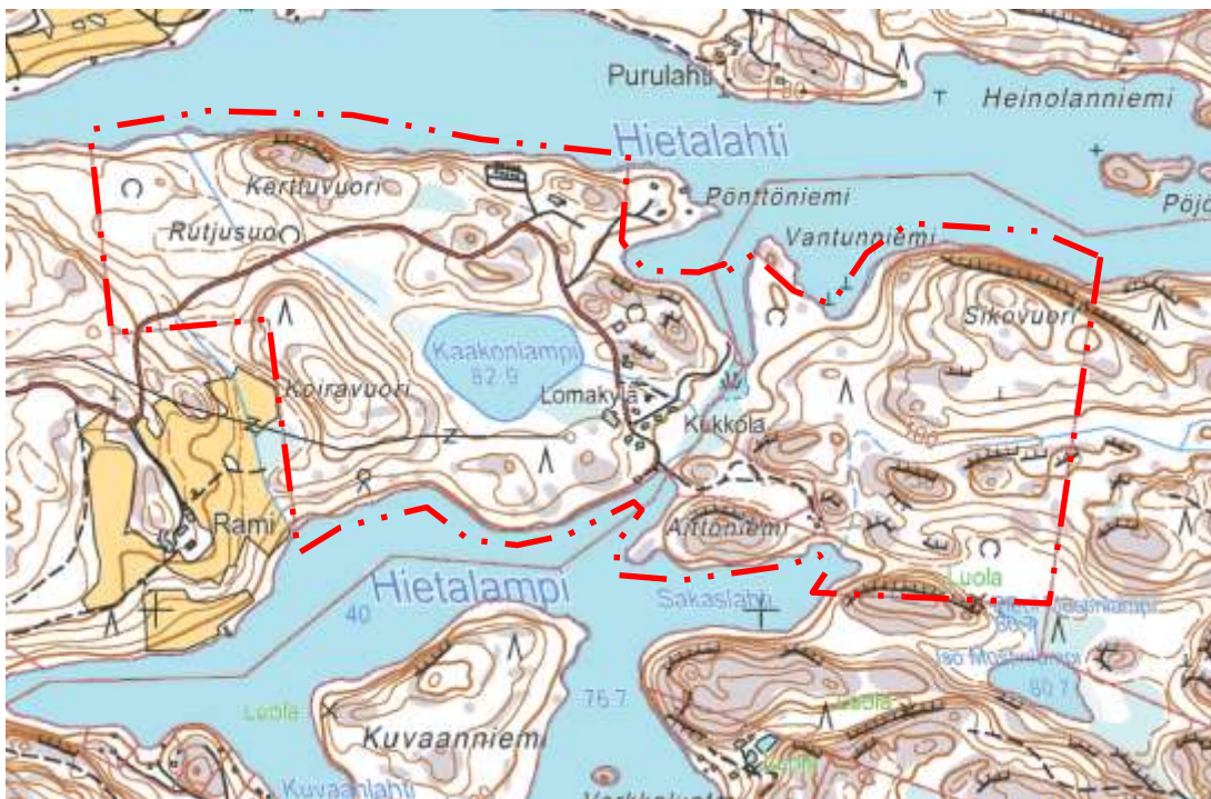
Kuva 1. Muutosalueen rajausta

Rantasalmen kunnan Rantasalmen lomakylän alueelle ja sen lähiympäristöön on tarkoitus laatia Haukiveden – Haapaselän rantaosayleiskaavan muutos, koska lomakylätoiminta on lähes hiipunut. Rantaosayleiskaavan muutos ja laajennus käsittää tilat 418-1-32, 1-46, 1-47 ja 428-9-6. Suunnittelualueen rajausta selviää oheisesta kuvasta.