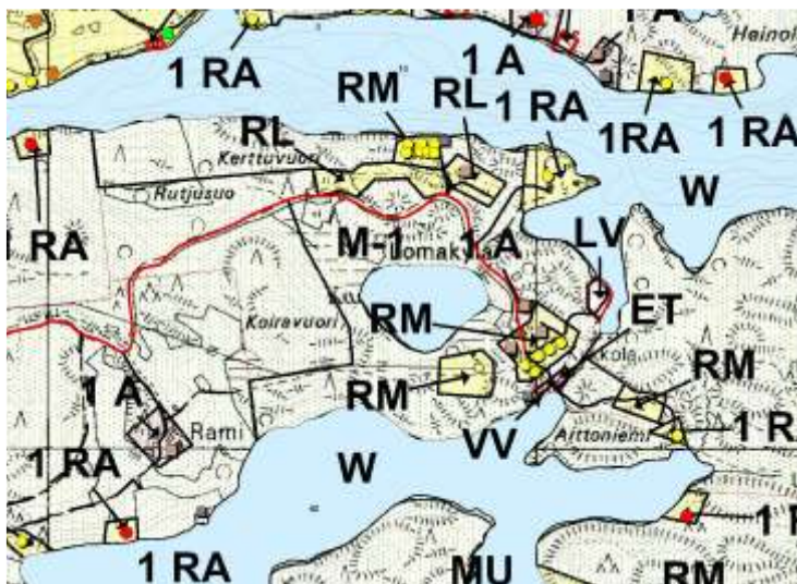
Kuva 3. Haukiveden – Haapaselän rantaosayleiskaava

Alueella on voimassa 7.2.2002 hyväksytty Haukiveden – Haapaselän rantaosayleiskaava. Yleiskaavassa on tehty aluevaraukset matkailupalveluiden alueelle, leirintä-alueelle, uimaranta-alueelle, venevalkama-alueelle, maa- ja metsätalous-alueelle, loma-asuntoalueelle sekä maa- ja metsätalousvaltaiselle alueelle.